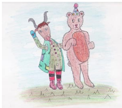
• Ilustrácia Nika Dvoranová

Február sa niesol aj v znamení tradícií. V téme kráľovských masiek sme spoločne strávili čas tvorením, zamýšľali sme sa nad kreatívnym zobrazením rôznych postaviek. Potom sme sa ponorili do čarovného sveta - a sami sme sa stali čarodejnicami, zvieratkami, princeznami, kovbojmi či dokonca kostrami. A pani učiteľky s nami!