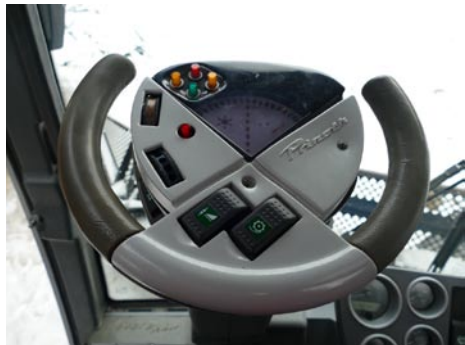
• Multifunkčný volant s ktorým sa ovláda smer ratraku a sú na ňom ovládacie prvky na frézu a navijak.

Ďalej sa dozvedáme, že tento mohutný stroj môže viesť len oprávnená osoba vlastníaca vodičský preukaz skupiny C a T. K tomu musí vlastniť osvedčenie o spôsobilosti riadiť takýto stroj. „Predovšetkým treba mať vzťah k ťažkej technike a človeka to musí baviť. Ak tomu ne-