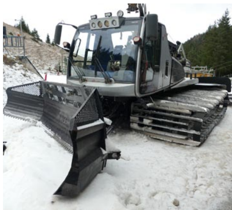
• Celý ratrak váži 12,5 tony

„Ratrak je zľudovené pomenovanie snežného pásového vozidla určeného na finálnu úpravu povrchu lyžiarskych terénov. Vybavený je radlicou na rozhrňanie, nahrňanie a frézou na zrovnávanie vrstvy snehu,“ odpovedá na našu otázku. Dozvedáme sa, že slúži aj na presun snežných diel na zjazdovke, dopravu potrebného materiálu a v krajnom prípade aj na dopravu osôb, ale len za dodržania určitých pravidiel. Kabína je určená pre vodiča a dve osoby. Na korbe sa človek prevážať nesmie.