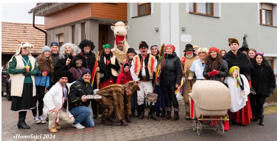
• Homrľajci 2024