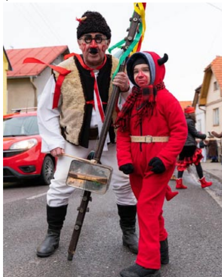
• Fašiangoš, Tarangoše

du. Starosta nadviazal, okrem poďakovania pripomenul, že práve takéto aktivity vyčaria ľuďom úsmev na tvári.