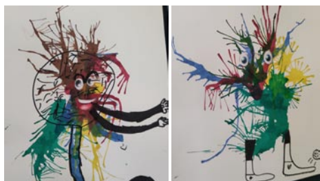
• Bacil, kresby žiakov 3. ročníka