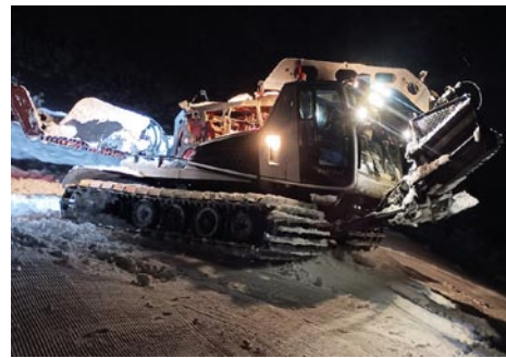
• Ratrak je schopný pracovať aj v noci

Čo pre vodiča predstavuje pri práci najväčšie nebezpečenstvo? „Skialpinisti, náhodní lyžiari, či turisti „naboso. Vôbec neregistrujú, že stroj visí na lane. Ak narazia do lana, hrozí vážny úraz, či fatálny koniec. Vyžaduje si to od vodiča obrovskú pozornosť a nutnosť sledovať okolie 10 m na jednu i druhú stranu od lana. Stalo sa, že jeden takýto lyžiar sa kryl za stroj, aby sme ho nevideli. Využíval svetlá stroja k pohybu na lyžiach. Keď som ho zaregistroval, dostal slovnú príučku: „Ak ti je život milý, tak sa rýchlo pober kade ľahšie. Našťastie sa všetko dobre skončilo, lebo lano bolo na zemi a stroj klesal nadol.“