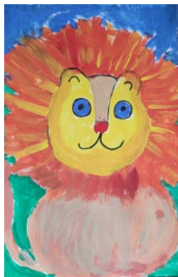
• Tomáš Majerčík, 1. ročník