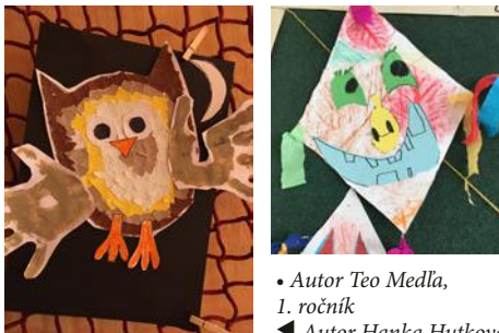
• Autor Teo Medla, 1. ročník ◀ Autor Hanka Hutková