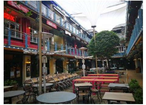
• Kingly Court v Carnaby Street. Je tam vždy obrovský frmol. Teraz sú všetky reštaurácie zatvorené

Žijem a pracujem v Londýne už dlhšiu dobu. Korone sme sa nevyhli ani tam. Moje pracovisko je zatvorené už od polovice marca. Keď vyhlásili druhý lockdown, rozhodla som sa pricestovať domov na Slovensko. Tu, na Slovensku, všetci nosia rúško aj vonku, čo je pre mňa nezvyčajné. V Anglicku ich musíme nosiť v interiéroch, či už je to obchod, dopravný prostriedok alebo stanica, avšak vonku je to na vlastnom uvážení.