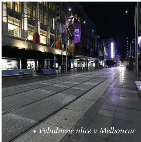
• Vyludnené ulice v Melbourne

Druhy „lockdown“ ktorý bol vyhlásený v júli platil len na Victoriu/Melbourne a podmienky boli tie iste (ale toaletný papier už ľudia nevykúpili...). Rúška boli povinné iba v druhom „lockdowne“ a doteraz sú povinné. Testovanie bolo dobrovoľné a zadarmo. Dokopy obidva „lockdowny“ trvali viac ako 5 mesiacov.