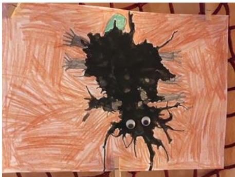
• Autor Hanka Hutková, 1. ročník