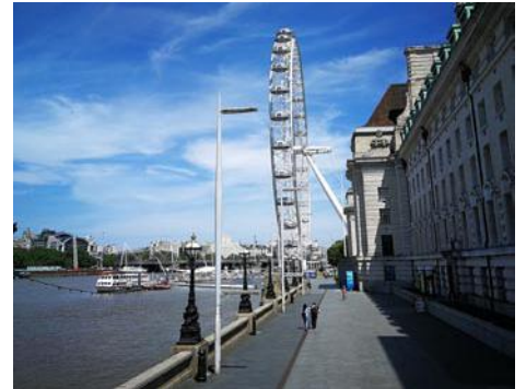
• South Bank, Londýnske Oko. Nikdy som to tu nevidela takéto prázdne

Žijem a pracujem v Londýne už dlhšiu dobu. Korone sme sa nevyhli ani tam. Moje pracovisko je zatvorené už od polovice marca. Keď vyhlásili druhý lockdown, rozhodla som sa pricestovať domov na Slovensko. Tu, na Slovensku, všetci nosia rúško aj vonku, čo je pre mňa nezvyčajné. V Anglicku ich musíme nosiť v interiéroch, či už je to obchod, dopravný prostriedok alebo stanica, avšak vonku je to na vlastnom uvážení.