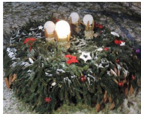
• Pred Jednotou COOP