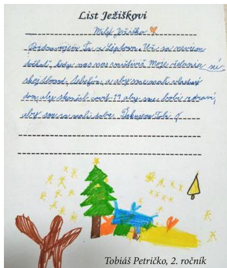
Tobiáš Petričko, 2. ročník