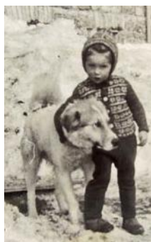
• Kvetka a Ďumbo, 1948

Spomínam si na pekárenskú pec, v ktorej naša mama každý deň piekla chlieb. V pamäti mi to utkvelo preto, že tam bolo najteplejšie. Tam sme sa zohrievali, keď sme sa polyžovali. Tiež si dobre pamätám na nášho dobrého psa.