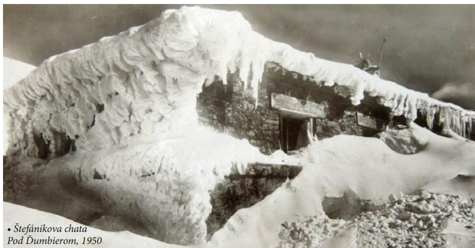
• Štefánikova chata Pod Ďumbierom, 1950