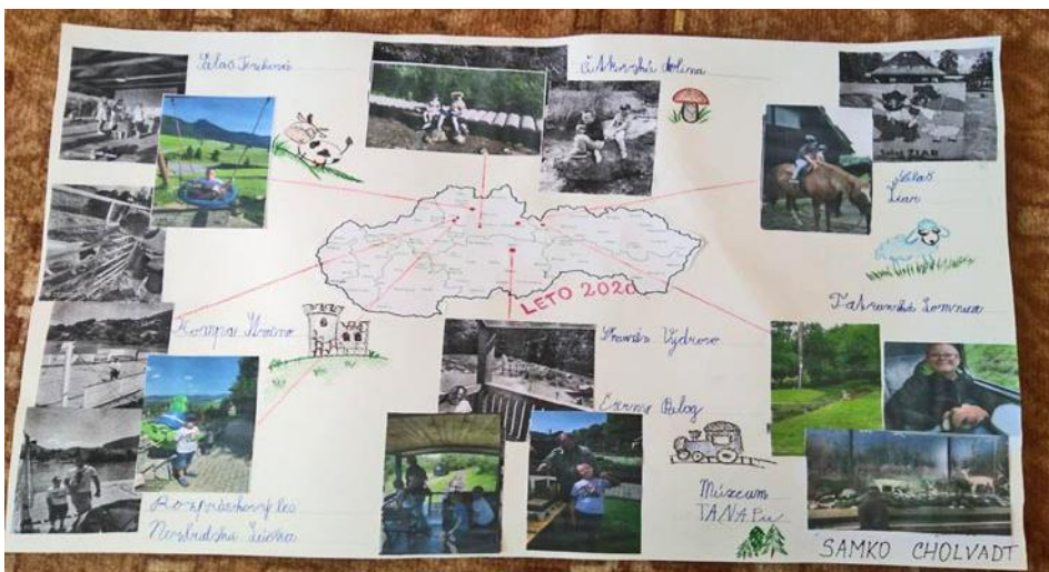
• Autor Samko Cholvadt, 4. ročník