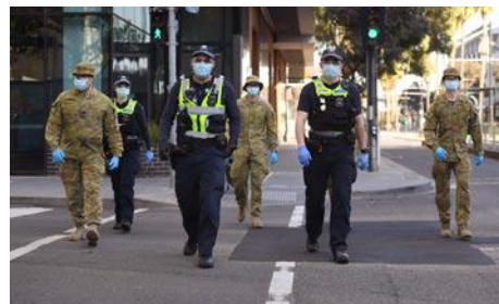
• V uliciach mesta hliadkujú policajti a vojaci.

15. apríla 2020: Boli prijaté právne predpisy o platbách JobKeeper ($750 na osobu na týždeň) na podporu Austráľčanov bez práce.