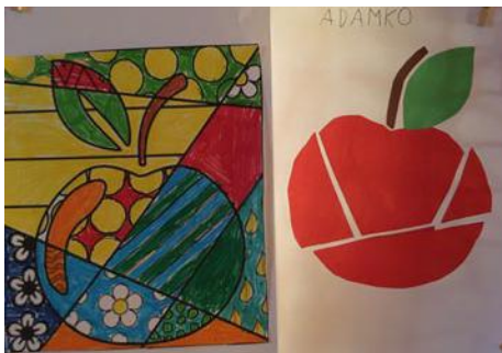
• Autor Adamko Líška, 1. ročník