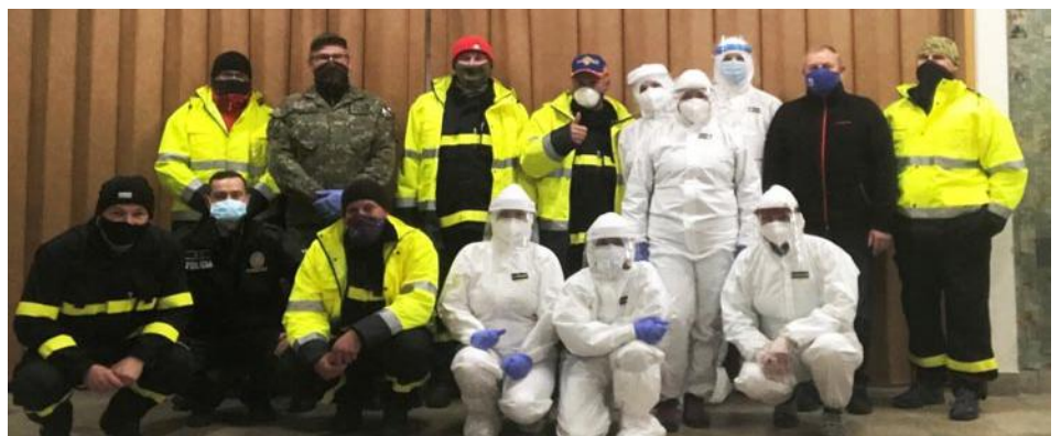
Testovací tím v Závažnej Porube pretestoval v prvom kole 856 ľudí, z toho pozitívni 13, t.j. 1,52 % a v druhom kole 860 ľudí, z toho pozitívni 3, t.j. 0,34%.