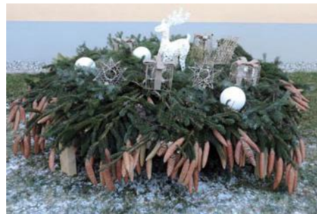
• Pred obecným úradom