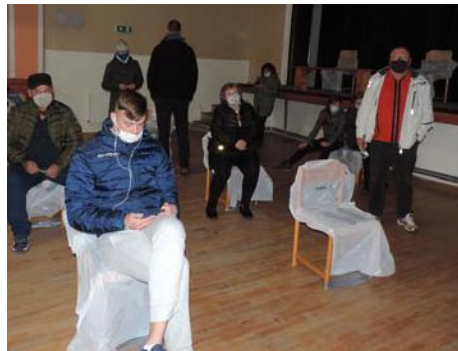
• Neviditeľná nervozita, čakanie na výsledok

Ludia boli rôzni. Myslím, že každý sa tak trochu bál a bol nervózny, čo sme samozrejme chápali. Stretli sme sa s každým typom ľudskej povahy, ale väčšina ľudí bola naozaj milá a vďačná nám za to, čo robíme.