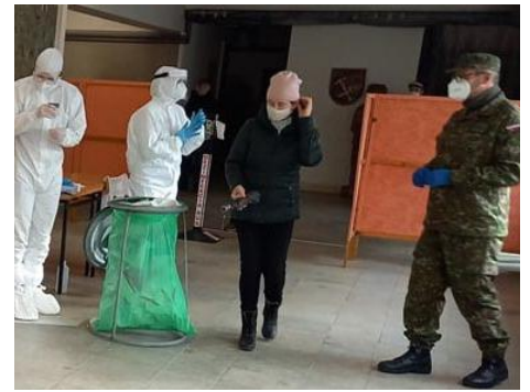
• každý sa tak trochu bál a bol nervózny, čo sme chápali.

Za víkend sme vyhodnotili približne 850 testov.