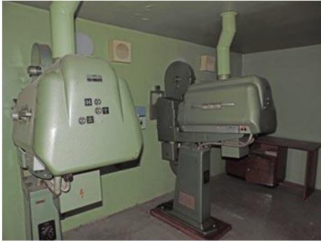
• Premietacie prístroje sú funkčné, zakonzervované, po servise schopné prevádzky.