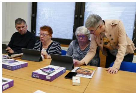
• Máte problém? Vysvetlíme, ukážeme, pomôžeme...

Pani magistra, ďakujeme za poskytnuté informácie. Nepochybujeme, že zapôsobia motivačne a premenia sa na inšpiráciu aj pre porubských seniorov. Už teraz je isté. Digiseniori žijú aj v Závažnej Porube a určite prejavia záujem o túto formu vzdelávania, ktorá určite zlepši kvalitu ich života.