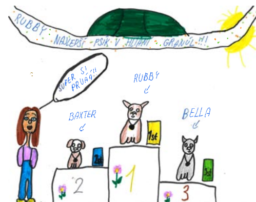
Kresba Paulína Migalová