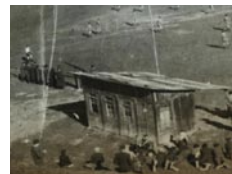
• Ihrisko a šatňa na Žiarci

V roku 1997 bola vybudovaná tréningová plocha prvá terasa, druhá terasa, tenisový kurt a plážové ihrisko.