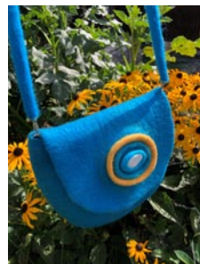
• Vlna na cestách. Svoje výrobky berie na netradičné miesta.

Mokrým plstením, teda spracovaním vlákien vlny pomocou vody a mydla, robí najmä šálky, plédy a kabelky. Je to technika, trochu náročnejšia na priestor, prípravu a čas, preto si kvôli nej prenajala malú dielňu. Najnovšie ju nadchla technika ekoprint, kde využije prírodné pigmenty z listov stromov na farbenie vlny. Za jeden z takýchto obrazov si nedávno odniesla Cenu Národného osvetového centra z celoslovenskej súťaže neprofesionálnych výtvarníkov. „Moja obľúbená technika je Arttex, malovanie obrazov vlnou. Poukladám k sebe pramienky farebnej vlny tak, aby vytvárali určitý motív. Umelecká časť je na mne, no nudnú manuálnu prácu už urobí stroj. Ten zabodne vlnu do podkladovej látky,“ vysvetľuje.