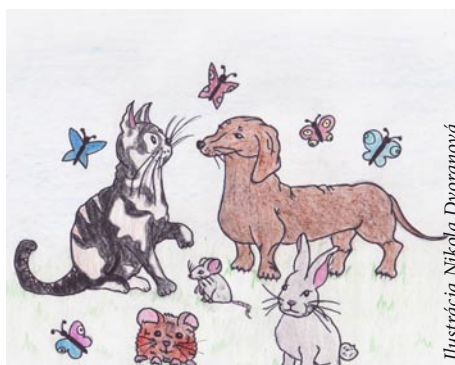
Ilustrácia Nikola Dvoranová