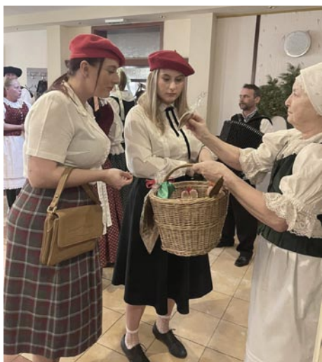
• Choreografia Jarmok, autor Mgr. art. Elena Chovanová. „Porubské dievčatá šli do trhu, kupovať baretky každá druhú...“

ve sa osvedčili naši svalnatí mládenci. Po mesiaci sme mája zložili, zaspievali a aj zatancovali. V júni sme sa zapojili do Porubského majálesu. Ako do sprievodu obcou, tak aj do programu. Potom sme sa už pripravovali na uvedenie Porubskej svadby v Skanzene Pribylina. Pretože lia- lo ako z vreca, účinkovali sme v kostole pred oltárom. V júli sme prispeli piesňou a tancom na zastavení Vínnej cesty v Dome Milana Rúfusa. Potom nasledovali prázdniny, čerpali sa dovolenky, ale neprerušili sme našu činnosť. Chodili sme čepčiť v Porube, vo Východnej, do Liptovských dvorov, do Demänovskej doliny, ba i do Važca.