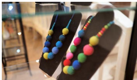
• Modrý kameň. Na hrade svoje vlnené šperky ukázala vlni

„Prvý raz som ovčiu vlnu spoznala ešte ako študentka umeleckej školy. Ide o mäkký, na dotyk príjemný materiál, no mne sa do rúk dostalo najhrubšie rúno, aké som dovtedy videla. Spracovávala som ho celý deň, až som si ruky zodrala do krvi. Vtedy som ešte netušila, že vlna môže byť aj hebká a jemná,“ priznáva sa. Následne na niekoľko rokov na vlnu zabudla. Venovala sa výskumu gemerskej čipky a paličkovaníu. Spolupracovala so španielskym časopisom o umení, jej víťazný obraz z medzinárodnej súťaže čipkárok dodnes zdobí kanceláriu primátora mesta Alicante.