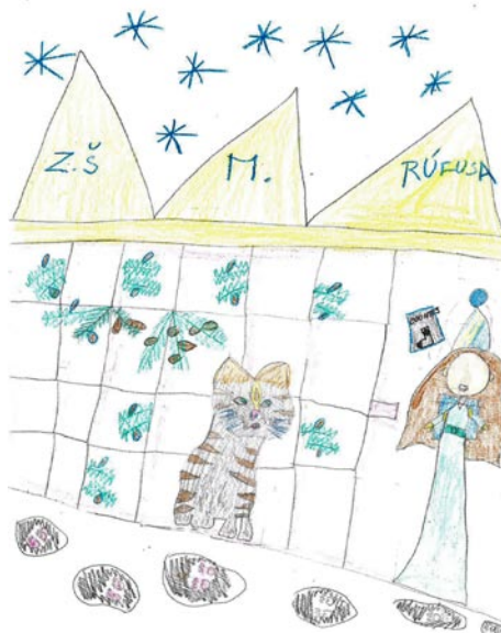
Kresba Stella Buzáková