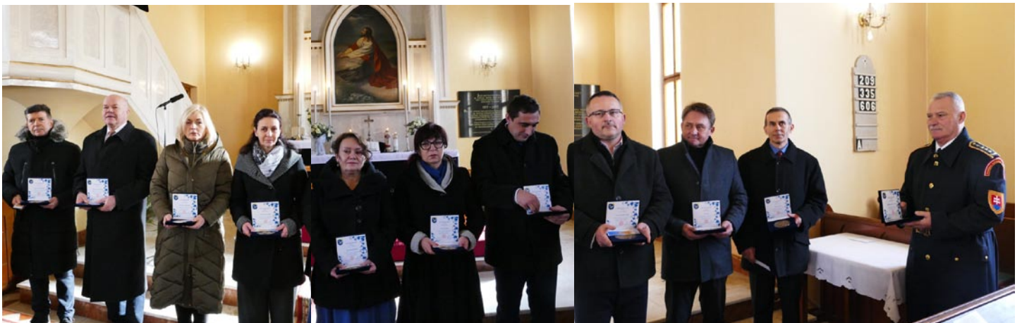
Vám patrí vďaka. Zástupcovia miest a obcí zľava: Liptovský Mikuláš, Liptovský Hrádok, Liptovská Porúbka, Kráľova Lehota, Liptovský Peter, Vavrišovo, Pribylina, Liptovská Kokava, Hybe, Východná, Oblastný výbor SZPB