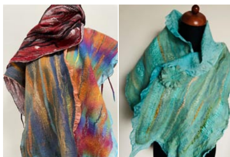
• Šálky. Vznikol technikou nuno plstenia, spojením vlny a hodvábu.

tisíc korún, v tom čase slušné peniaze. No mali sme nevelký byt a v ňom plno umeleckých čačiek a lyží. Manžel vyhlásil, že ak do niektorej z izieb ešte donesiem krosná, v obývačke bude bývať jeho vlčiak, ktorého mal u rodičov. A bolo po krosnách,“ usmieva sa pani učiteľka. Na kreatívnom festivale v zahraničí neskôr uvidela očarujúco jemné plstené šálky žiarivých farieb z merino vlny.