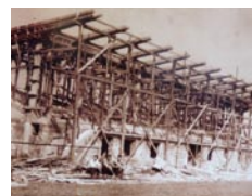
• Výstavba krytej tribúny

Futbalový klub ŠK Závažná Poruba bol založený v roku 1931. Prvé ihrisko bolo na „Smrečskom močiarí“ (pri ceste na Hotel Jaslovské Bohunice).