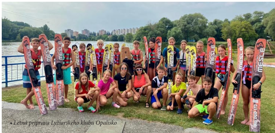
• Letná príprava Lyžiarskeho klubu Opalisko