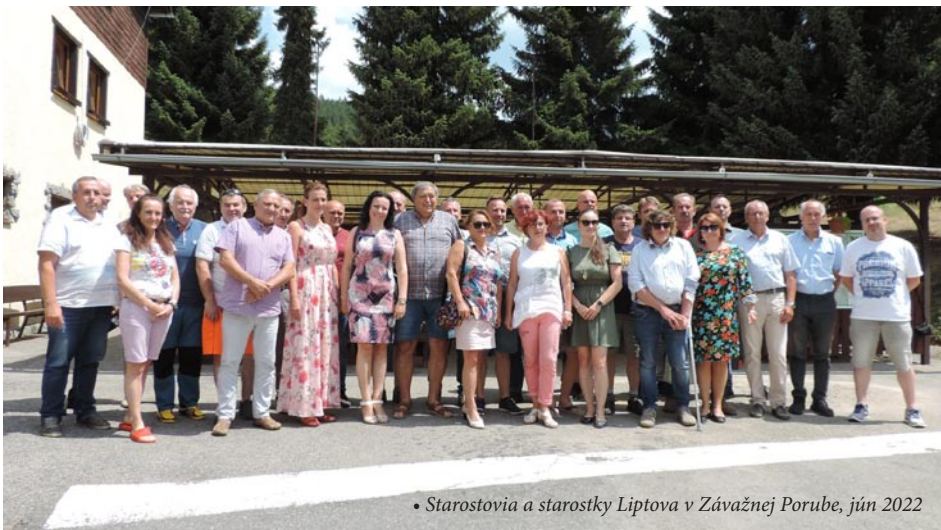
• Starostovia a starostky Liptova v Závažnej Porube, jún 2022