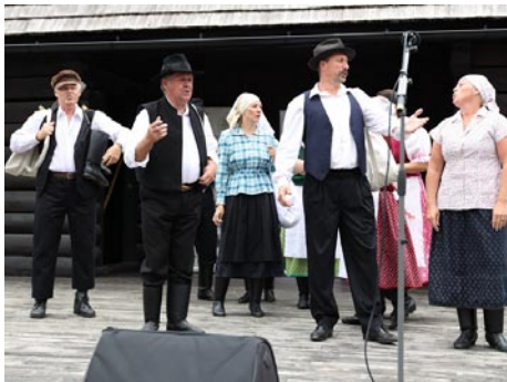
• Privítanka