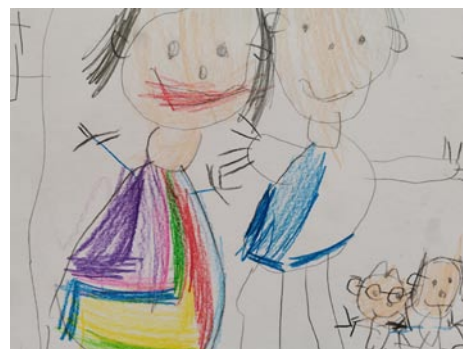
• Autor Filipko Uhliarik, 5 rokov