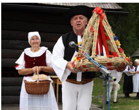
• Dožinky