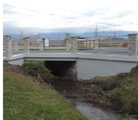
• Opravený most pri Brodke, november 2015

Pokračovali sme čulým družobným stykom s gminou Nowý Targ, ako aj moravskými Bohuslavcami.