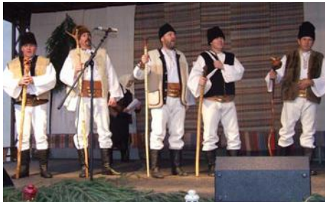
• Na Tomáša

Prvú adventnú nedeľu pripravilo Liptovské kultúrne stredisko v Liptovskom Mikuláši na Nádvorí Čierneho orla pásmo predvianočných zvykov od Kataríny do Štedrého večera. V programe účinko-