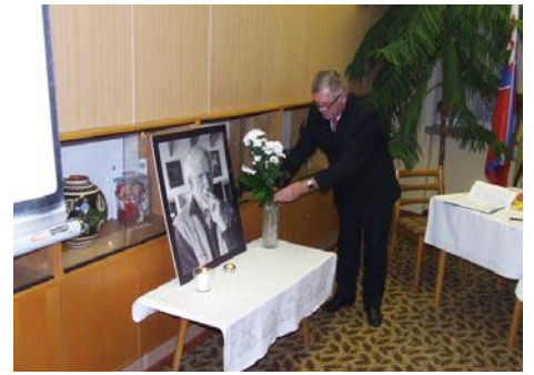
• Pocta a úcta Majstrov slova od rodných