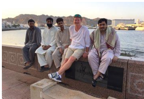
• V zajatí miestnych taxikárov neďaleko trhu v Muscate (v pozadí kotví sultánova súkromná jachta)