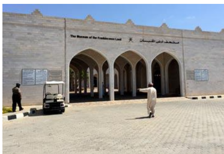
• Múzeum kadidla na juhu Ománu v meste Salalah

Naše prvé kroky v Ománe smerujú do mesta Salalah v provincii Dhofar, jedného z najväčších miest celého sultanátu, ktoré sa nachádza neďaleko hraníc s Jemenom. Víta nás obrovské moderné letisko, ktoré má ale jednu zvláštnosť. Napriek svojej veľkosti a pompézosti je naše drobné lietadlo jediné, ktoré tu široko-ďaleko pristálo. Neskôr sa dozvedá-