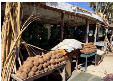
• Poulíčny predaj čerstvých kokosov a banánov je súčasťou miestneho života

Ako som už spomínal, Omán je štátnym zriadením sultanát. To znamená že na čele unitárnej absolutistickej monarchie s vlastným parlamentom stojí od roku 1970 až dodnes neohrozený sultán Qaboos bin Said al Said. Narodil sa práve v blízkosti mesta Salalah a počas jeho vlády prešiel Omán obrovskými zmenami. K moci sa dostal bezprostredne po smrti svojho otca Said bin Taimura, ktorý nebol naklonený zmenám a len ťažko investoval financie do rozvoja krajiny. Jeho syn sa však rozhodol smerovať krajinu inou cestou. Do roku 1970 boli v Ománe len tri školy a jedna nemocnica v hlavnom meste Muscat, ktoré je od Salalah vzdialené viac ako 1000 kilometrov. Dnes má táto krajina takmer 1200 škôl a moderne vybavené zdravotné zariadenia nájdete aj v najza-