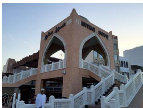
• Murtaḥ Souq – tržnica v centre starého Muscatu

Po niekoľkých dňoch cestovania prevažne juhom krajiny sa dostávame do hlavného mesta Muscat. Je to najväčšie mesto v Ománe, kde okrem univerzity, krásnej budovy opery, ministerstiev, sultánovej jachty a bývalého sultánovho