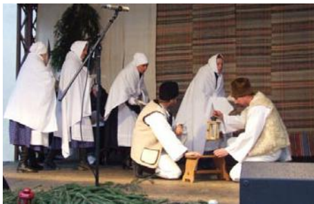
• Na Luciu

Prvú adventnú nedeľu pripravilo Liptovské kultúrne stredisko v Liptovskom Mikuláši na Nádvorí Čierneho orla pásmo predvianočných zvykov od Kataríny do Štedrého večera. V programe účinko-