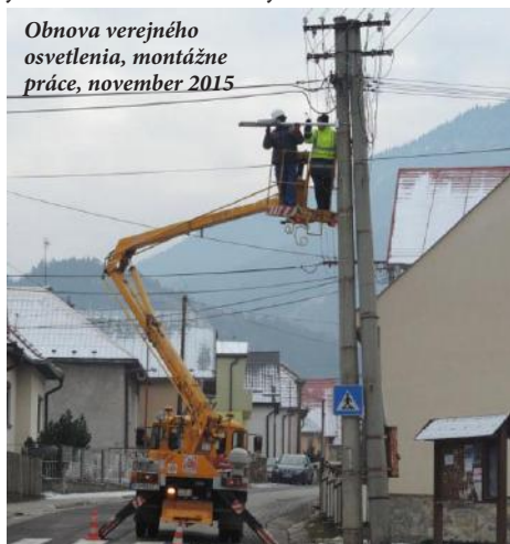
Obnova verejného osvetlenia, montážne práce, november 2015

Európsky fond regionálneho rozvoja, investícia do Vašej budúcnosti.