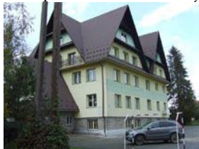
• Budova školy Jozefa Tischnera v Rohožníku