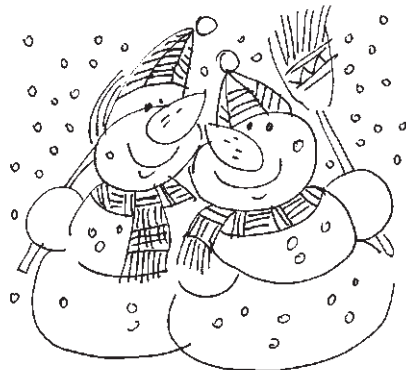
• Snehuliak si prosí, dva mrkvové nosy.

Na most pri Brodku sa podpísal zub času. Samospráva Závažnej Poruby preto pristúpila k opraveniu tejto exponovanej dopravnej stavby. V pondelok 19. októbra 2015, po predchádzajúcej príprave a viacerých konaniach sa začali stavebné práce smerujúce k oprave narušenej mostnej konštrukcie. Na túto nemalú investičnú akciu obec získala prostriedky z Úradu vlády SR v celkovej výške 11 000 €.