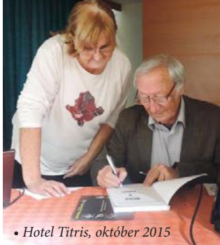
• Hotel Titris, október 2015