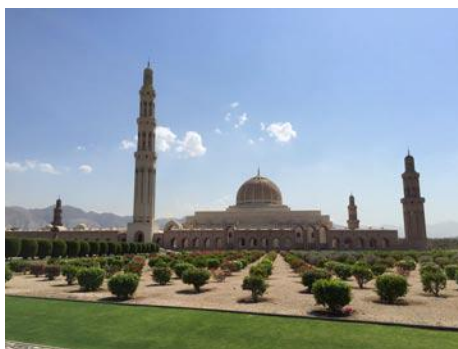
• Veľká mešita sultána Qaboosa v Muscate je naozaj majestátné dielo architektúry

Muscat ako taký má dve časti – staré mesto, kde aj dnes zažijete nefalšovanú atmosféru miestneho trhu nazývaného Souq. Na tomto mieste muži v tradičných dlhých bielych šatách nazývaných dishdasha v tieni historických budov a