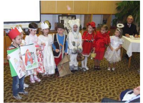
• Najmenší štebotajú verše básnika