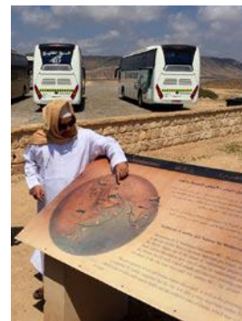
• Na potulkách vnútrozemím Ománu kde sa dozvedáme viac o historických obchodných plavbách

strčenejšej dedinke vo vnútrozemí. Okrem toho zdravotná starostlivosť je pre všetkých obyvateľov Ománu bezplatná, rovnako ako bezplatné je aj školstvo. Podľa slov nášho sprievodcu sultán Qaboos je pre Ománcov