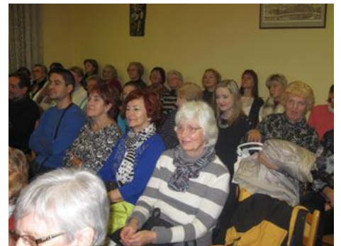
• Jedni recitovali, druhí počúvali.