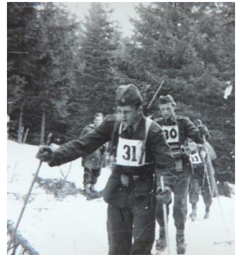
• Ako lyžiar – vojak na trati, Pec pod Snežkou

Vyznal sa aj zo svojho vzťahu k športu. „Každý chlapec v čase mojej mladosti lyžoval. Dobré si spomínam, že v skoku na lyžiach som sa stal majstrom Závaž-