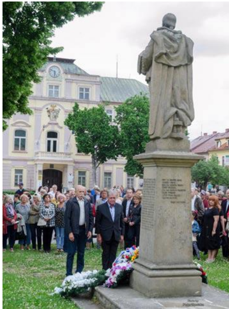
K soche Belopotockého vencie položilo i 3GD zo Závažnej Poruby

Rok 2020 nevnímame len ako Rok slovenského divadla, ale aj ako rok 190. výročia prvého ochotníckeho predstavenia, ktoré sa konalo v Liptovskom Mikuláši zásluhou G. F. Belopotockého. Spomienkové podujatie sa začalo 15. júna 2020 o 17. hodine pred Čiernym orlom otvorením série akcií pod názvom Pocta Belopotockému. Prítomní si najskôr prezreli ex-teriérovú výstavu v Ulici 1. mája. Potom nasledoval akt kladenia vencie pri soche Belopotockého. Vencie položili predstavitelia mesta, kultúrnych organizácií a 28 zástupcov ochotníckych divadiel z Liptova. Veniec položilo aj divadlo 3GD zo Závažnej Poruby. Pred budovou Múzea Janka Kráľa uviedli členovia Matičnej ochotníckej scény predstavenie o živote a práci G. F. Belopotockého. Vo veľkej sále DK v L. Mikuláši otvorili bannerovú výstavu fotografií o ochotníckom divadle v Liptove od roku 1830 až po súčasnosť.