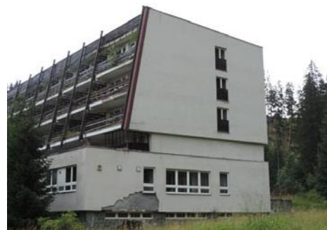
• Hotel Bohunice, 2020

Posledné zasadnutie RVHP bolo v Budapešti 28. júna 1991, a ako vysvetlil Naniaš, na ňom bolo dohodnuté, že bude do 90 dní rozpustené.