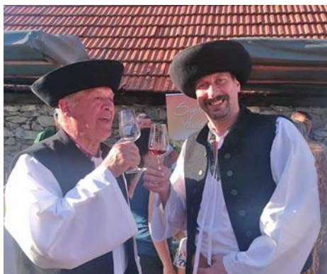
Text: -dm- Viac www.mvc.sk

Predstavila sa aj country skupina Arion. Zaujímavá aktivita vinárov a Závažnej Poruby prítomných oslovila a stala sa inšpiráciou pre konzumáciu kvalitných slovenských vín.