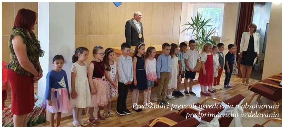
Predškóláci prevzali osvedčenia o absolvovaní predprimárneho vzdelávania