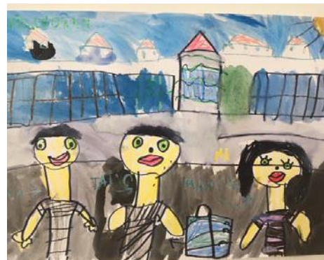
Davidko Dvoran, 1. ročník