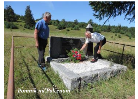
Pomník na Polčennom