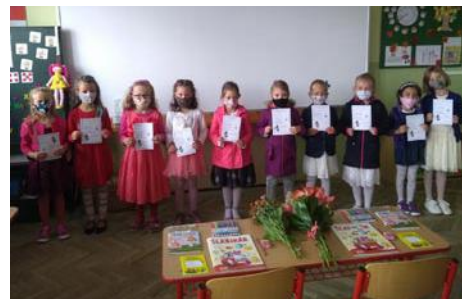
• Naše prváčky (10)