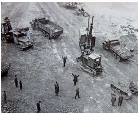
Technika v kameňolome, 60. roky 20. storočia