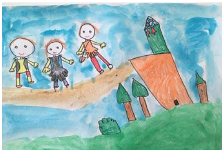
• Hanka Hutková, 1. ročník