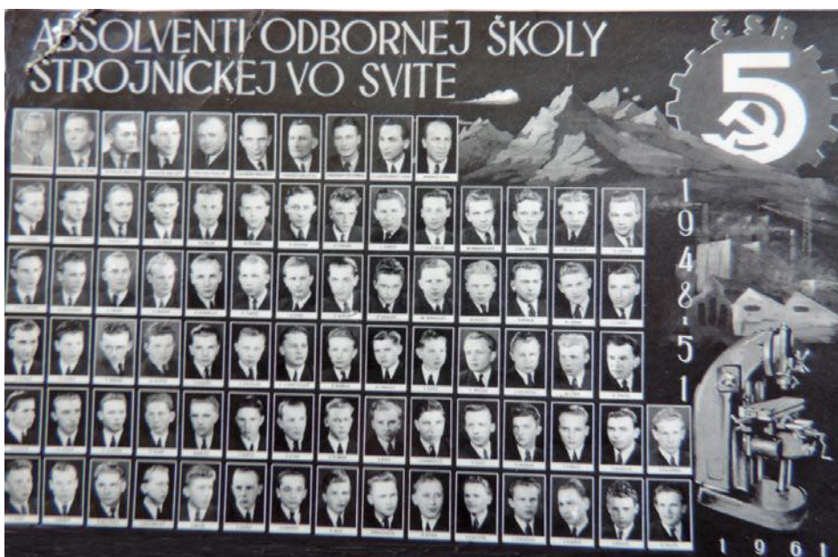
• Tablo z roku 1951. Život potvrdil, že priateľstvo z mladosti predstavuje vysokú hodnotu.