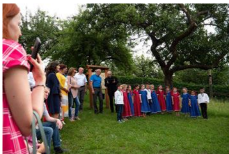
• Slávnostné otvorenie včelnice

Lúka za domom Milana Rúfusa a požiarnou zbrojnicou v Závažnej Porube sa celá kosiť nebude. Úmyselne. Aby mali včely miesto pre svoj pracovitý život.