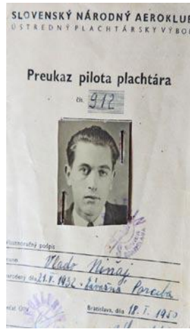
• Pilotný preukaz

neopúšťala. Absolvoval plachtársky kurz na bezmotorové lietadlo. Stále opatruje pilotný preukaz. Súčasťou výcviku boli i zoskoky. Spolu absolvoval tri zoskoky z lietadla. Ako dva desaťročný nastúpil na základnú vojenskú službu do Kvildy v južných Čechách (1952 – 1954). „Slúžil som za Čepičku. Bol to minister národnej obrany, žiadal disciplínu a poriadok. Velitelia nám často prízvukovali: Ťažko na cvičisku, ľahko na bojisku. Bola to vojna ako remeň,“ dodal. Po šesťmesačnom kurze v poddôstojníckej škole obsluhoval vojenský radar ruskej výroby. Potom slúžil u bojových útvarov na Šumave. Neskôr ho prevelili do Prahy, kde si spravil aj vodičský preukaz.