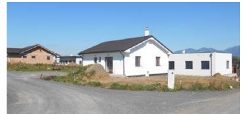
• V novom stavebnom obvode v tomto roku rastú nové domy ako huby po daždi.

- Obchvat Liptovský Mikuláš – Iľanovo - Ploštín – Priemyselná zóna treba riešiť križovatku v Okoličnom napr. pridaním tretieho pruhu a kruhovým objazdom na križovatke na Podbreziny. Ale kedy to bude vyriešené, to sa nevie presne.