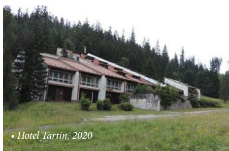
• Hotel Tartin, 2020