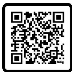
Naskenuj pre viac fotiek

V sobotu 6. apríla 2024 sa konalo druhé kolo prezidentských volieb, ale taktiež sme sa stretli hneď ráno na zastávkach.