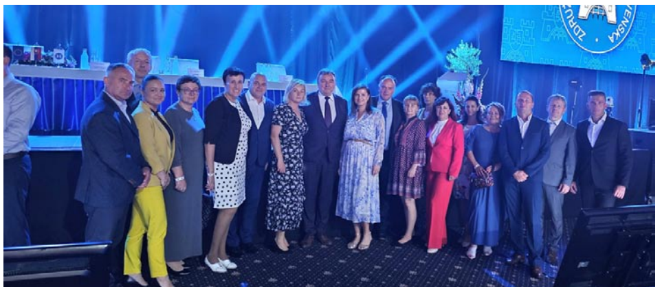
• Delegácia starostov z okresu Liptovský Mikuláš na sneme ZMOS v Bratislave