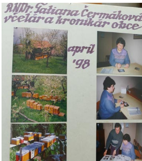
• Obecná kronika 1998

Dovoľte mi, milí čitatelia, takto zložiť hold pravidelnosti Porubských novín. Možnosť vrátiť sa v čase k informáciám z pred takmer 10 rokov, aby sme na to mohli nadviazať dnešným článkom, len poukazuje na dôležitosť mapovania života v obci Porubskými novinami. Pilnej redakcii a dlhoročnému úspešnému šéfredaktorovi patrí úcta a poďakovanie.