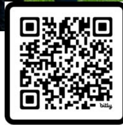
Viac o školskej včelnici

Som asistent úradného veterinárneho lekára, mám na starosti včelstvá v 5 obciach - cca 500 rodín. Včely nemajú len plusy, ale aj mínusy a to vo forme chorôb. Najväčší strašiak je samozrejme mor včelieho plodu a hniloba včelieho plodu, ktoré podliehajú, v prípade ich výskytu, hláseniu a následnému laboratórnemu vyšetreniu. A v prípade potvrdenia ná-