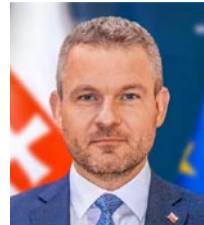
Peter Pellegrini, prezident SR

je hlavou Slovenskej republiky a hlavným veliteľom Ozbrojených síl Slovenskej republiky. Podľa Ústavy Slovenskej republiky prezident reprezentuje republiku navonok i dovnútra a svojim rozhodovaním zabezpečuje riadny chod ústavných orgánov. Prezidenta volia občania Slovenska od roku 1999 v priamych voľbách tajným hlasovaním. Funkčné obdobie prezidenta SR je päť rokov. Sídлом prezidenta je Grasalkovičov palác v Bratislave. Prezident SR ako symbol svojej funkcie používa štandardu prezidenta Slovenskej republiky. Štandard sa používa na označenie trvalého alebo dočasného sídla hlavy štátu a môže sa tiež použiť pri výkone jeho funkcií.