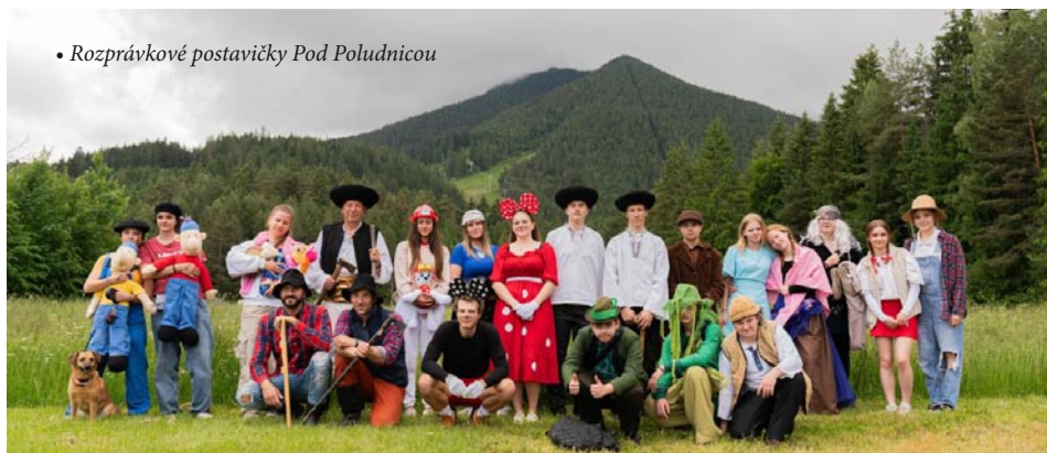
• Rozprávkové postavky Pod Poludnicou

Text: Petra Jurečková