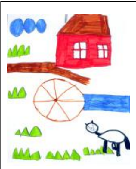
• Michalka Macková, 1. ročník