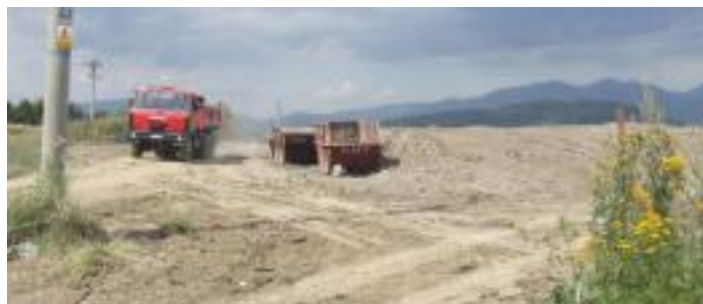
• Skládka stavebnej suty v Lopatine po rekultivácii, august 2006

Je to skládka stavebnej suty. Tu sa robí rekultivácia. Z envirofondov sme získali 700 tisíc korún, k tomu obec doplatila 150 tisíc korún. Proces rekultivácie je rozdelený na päť etáp. Ukončili sme už dve etapy. Kapacita skládky zostáva ešte asi sedem tisíc kubíkov. Práve z príjmov za uskladnenie stavebnej suty vykompenzujeme straty, ktoré máme medzi celkovými nákladmi na zber odpadov v Závažnej Porube a poplatkami občanov. Jedná sa asi o sumu 150 tisíc korún.