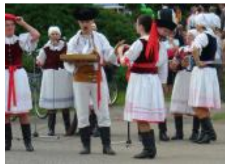
• Poludnica v Bobrovci, august 2006