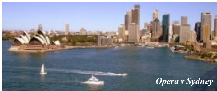
Opera v Sydney