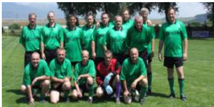
• „Starí páni“ Ondrašová