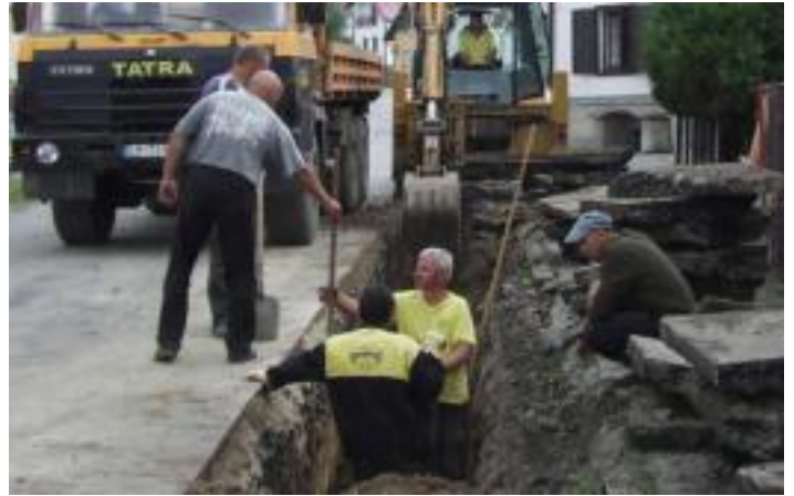
• Výstavba kanalizácie smerom k domu smútku, júl 2006

lebného obdobia to bolo asi 8 miliónov korún. Tu treba povedať, že v poslednej chvíli sme nastúpili na rýchlik ochrany životného prostredia, nakoľko sme obec do 2000 obyvateľov. Po vstupe do Európskej únie dostávajú prednostne prostriedky obce nad 2 tisíc obyvateľov. Vďaka týmto prostriedkom, ktoré sme ešte stihli, môžeme uviesť, že naša obec bude asi na 80 % odkanalizovaná. V priebehu troch rokov by sa mali všetky práce ukončiť. Už je vypracovaný harmonogram, ale treba sa nám spojiť s Ilanom a Liptovským Mikulášom, aby sme sa dostali do kategórie nad počet 2000 obyvateľov. To je podmienka EÚ.