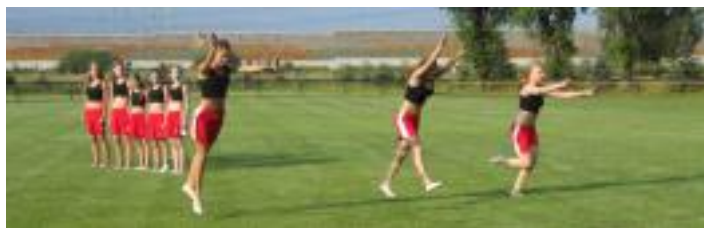
• Spetrením turnaja bolo vystúpenie porubských gymnastiek