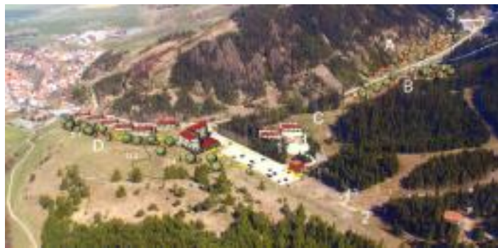
• Projekčný zámer výstavby rekreačnej zóny v doline Suchá LEGENDA: 1-chaťa Opalisko, 2-lyžiarsky areál, 3-hotel Tatrín, 4-rekreačné zariadenie Bohunice, A-B chatová osada, D-apartmánové domy

Oslovili sme Slovenské elektrárne o finančnú spoluúčasť na vybudovanie kanalizácie hore dolinou až po čističku EBO Jaslovských Bohuníc. Je tu ochota a pokiaľ by sme vedeli zabezpečiť finančnú skladačku a získať spoluinvestorov, ktorí majú záujem o výstavbu u nás, v rekreačnej zóne, tak by sa mohla kanalizácia vybudovať až pred Suchú. Ide o investíciu vo výške asi štyroch miliónov korún.