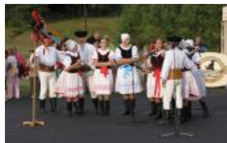
• Poludnica vo Vavrišove, júl 2006