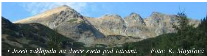
• Jesen zaklopala na dvere sveta pod tatrami.