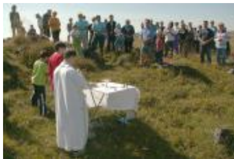
• Svätá omša na Poludnici 15. 9. 2006