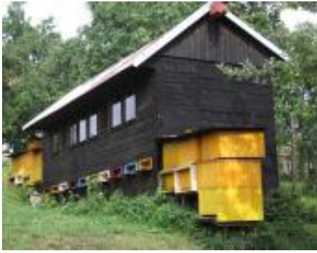
• Jeden z posledných včelínov v Závažnej Porube. Včelín patrí autorovi tohoto článku.

potravina - obsahuje glukózu (hroznový cukor) - fruktózu (ovocný cukor) - sacharózu - dextríny - bielkoviny viazané s inými látkami ako i voľné kyseliny.