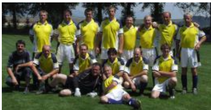
• „Starí páni“ Závažná Poruba. Na turnaji si zahráli proti sebe.