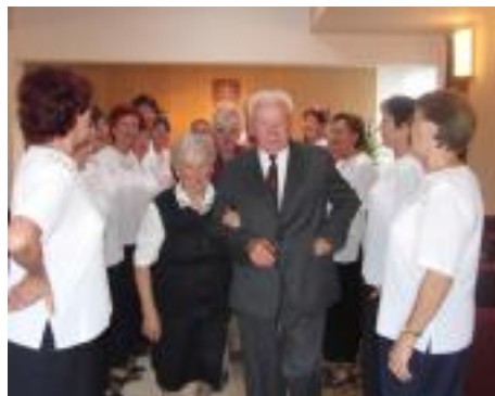
• Želáme Vám, aby slnko šťastia, ktoré vám svieti na spoločnú cestu životom už 60 krásnych rokov, nikdy nezapadlo.

Nechajme však hovoriť jubilatov: „V roku 1949 som nastúpil do textilky ako strojní mechanik. Nielen v dobe „šichy“ rozmýšľal ako pracovné operácie uľahčiť, urýchliť.. Predkladal som zlepšovacie návrhy a veru si ma aj všimli. Až do Hradca Králové som vycestoval prevziať rezortné vyznamenanie Najlepší pracovník od ministerstva ľahké-