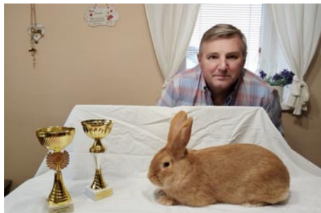
• Šampión z výstavy Nitra 2024, so svojím chovateľom

Králik zo Závažnej Poruby sa stal v roku 2024 šampiónom Slovenska.