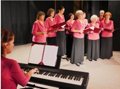
• Ženská spevácka skupina

JDS Závažnej Poruby združuje 130 členov. Co predstavuje 10 % všetkých obyvateľov obce.