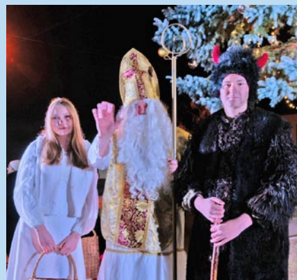
• Mikuláš s anjelom a čertom