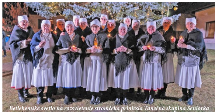
Betlehemske svetlo na rozsvietenie stromčeka priniesla Tanečná skupina Seniorka

Volili sme prezidenta i Európsky parlament. Personálne zmeny nastali v obecnom zastupiteľstve, na obecnom úrade i v evanjelickom cirkevnom zbore. V školách sa zvýšil počet žiakov. V MŠ sa vytvorila tretia trieda. V ZŠ MR pribudla asistentka učiteľa. Nastúpila nová školníčka. Zaznamenali sme okrúhle jubileá. Porubské noviny vychádzajú 30 rokov, desať rokov účinkuje Tanečná skupina Seniorka a tridsať rokov pôsobí aj domáca JDS. Pripomenuli a v auguste oslávili 80 výročie slávneho SNP. Divadlo 3 GD 10x odohralo Pyšnú princeznú doma i vonku. Našu obec zviditeľnilo na celoštátnej divadelnej prehliadke Divadlo deťom v Rimavskej Soboti.