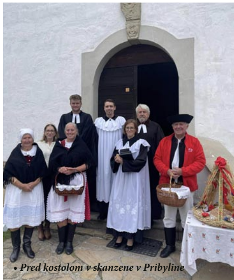
• Pred kostolom v skanzene v Pribyline

V nedeľu 6. októbra 2024 sme Božím slovom, modlitbou a nábožnou piesňou na slávnostných službách Božích v Závažnej Porube poďakovali za úrody zeme i všetko, čo nám Hospodin počas roka dával a my sme prijímali.