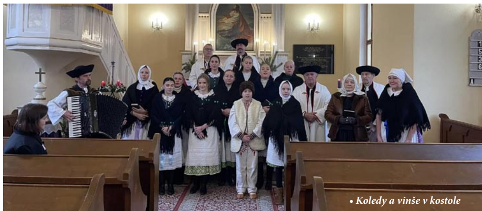
• Koledy a vinše v kostole